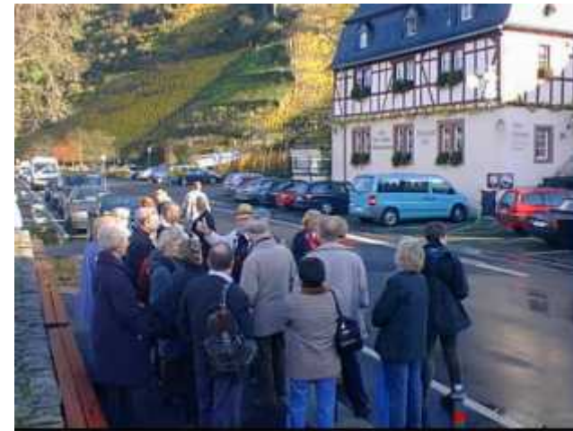
Die Gruppe am Moselufer in Beilstein