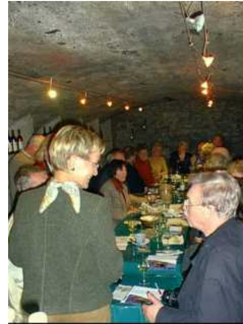
Probe im Weingut Hess