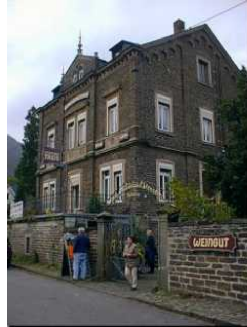
Haus Treis in Eller, ein imposantes Winzerhaus in klassischer Moselarchitektur