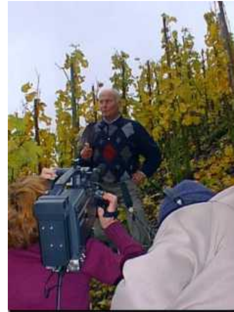
Im Calmont, Interview mit dem WDR