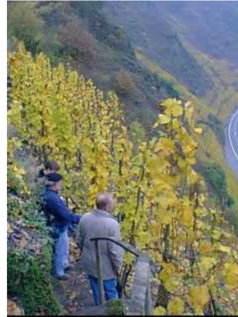
Blick aus dem Calmont

Ein Besuch in Beilstein durfte natürlich nicht fehlen. Am Samstag Morgen spazierten wir unter ortskundiger Führung durch die engen Gässchen des malerischen historischen Ortes. Mittags saßen wir bei herrlich mildem Herbstwetter im Hof der Burg Metternich oberhalb von Beilstein zu einer Stärkung zusammen und genossen die Sicht auf die von der Sonne